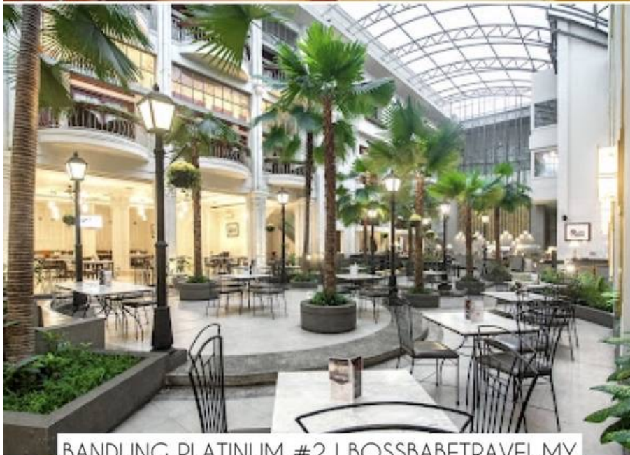
BANDUNG PLATINUM #2 | BOSSBABETRAVEL.MY