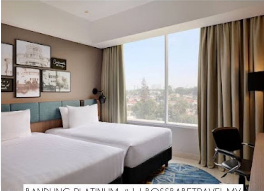
BANDUNG PLATINUM # 1 | BOSSBABETRAVEL.MY