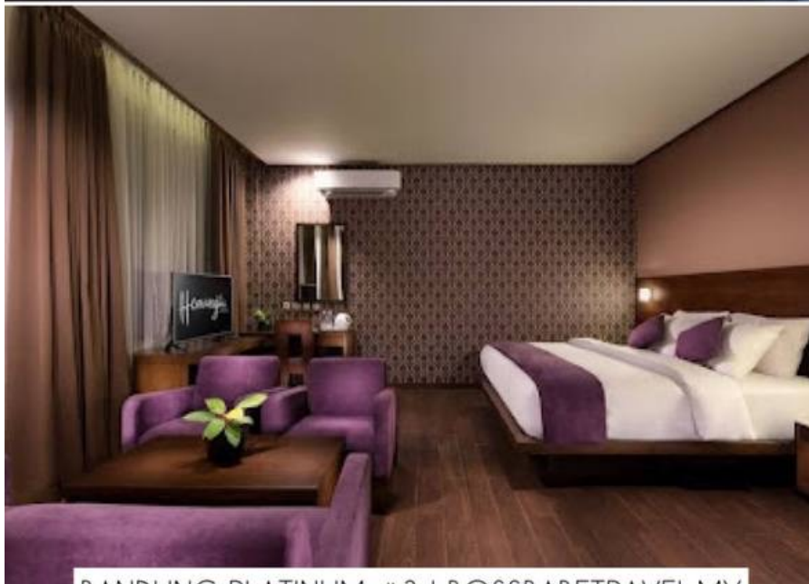
BANDUNG PLATINUM #3 | BOSSBABETRAVEL.MY